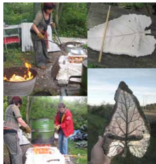
Demonstration av rakubränning Smedsstugan på Sand