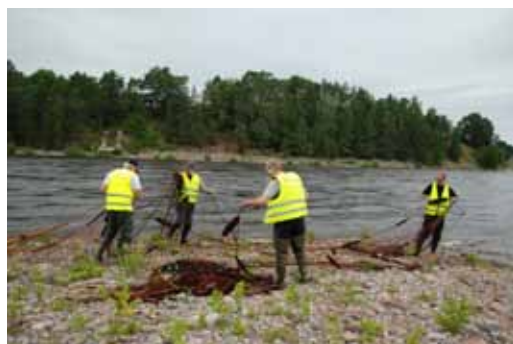
Notdragning vid Sandstugorna